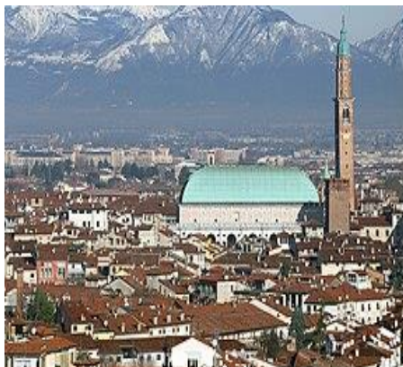
Paesaggio cittadino di Vicenza.

Fonte dati: ‘Dati al via’ a cura dell’USR per il Veneto