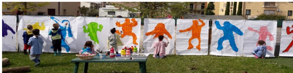
Scuola dell’infanzia Rossato (IC Ciscato di Malo) Vicenza.

GIOCANDO S’IMPARA quanti processi si attivano con semplici attività: sensorialità, motricità fine, percezione visuo-spaziale, scrittura e riconoscimento del numero, coordinazione oculo manuale.