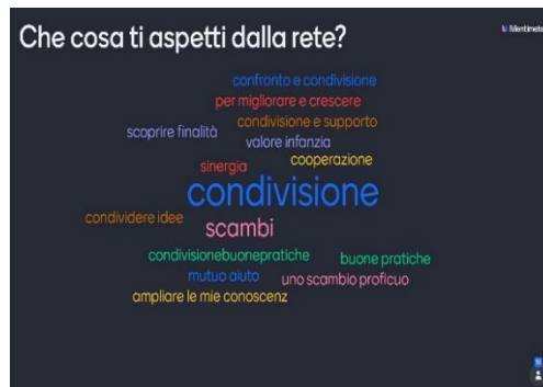
Nuvola di parole sorte durante il primo incontro di rete dai docenti di un gruppo di lavoro

(A cura di Lilly Carollo lilly.carollo@posta.istruzione.it )