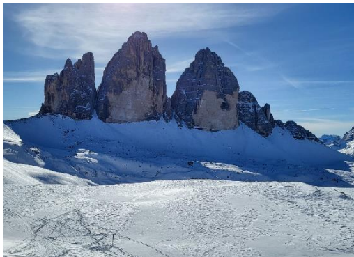
Le tre cime di Lavaredo al confine tra Belluno e Trentino