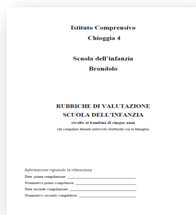
Scuola dell'Infanzia Brondolo Rubrica di valutazione scuola/famiglia