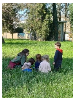
Scuola Inf. Laghetto, IC 8 Vicenza tirocinante in ascolto e osservazione