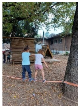
Scuola Infanzia Laghetto, IC 8 Vicenza: Facilitazione di relazioni interpersonali: la camminata in due sulla corda