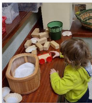
Bimbo intento alla ricerca dell'equilibrio nella creazione di una macchinina al nido Villaggio del Sole