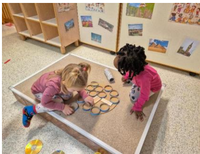
Bimbe in collaborazione per la creazione di una pizza speciale con materiale destrutturato al nido Villaggio del Sole