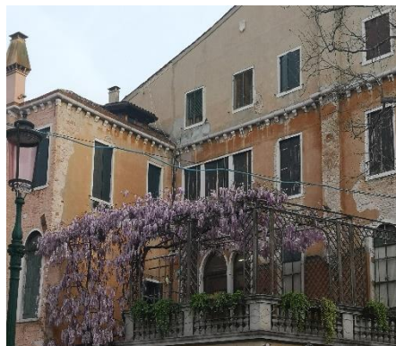
Campo San Giacomo dall'Orio