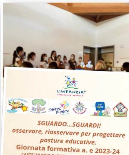
Giornata formativa Staff Cooperative L'Infanzia Lugagnano di Sona Verona