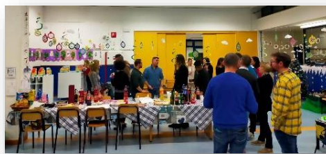
Apericena con i genitori Scuola dell'infanzia "zattieri del Piave" Ponte nelle Alpi