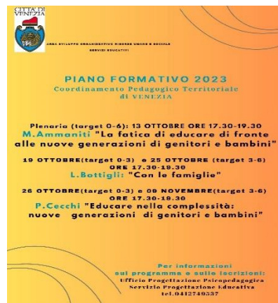
Piano di formazione congiunta CPT VENEZIA 2023