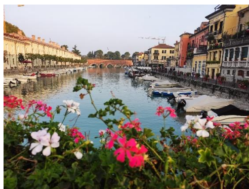
Ponte sul Mincio a Peschiera del Garda (VR)