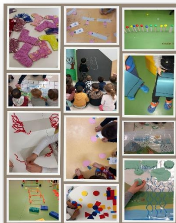
Scuola dell'infanzia "V. da Feltre" Bornio