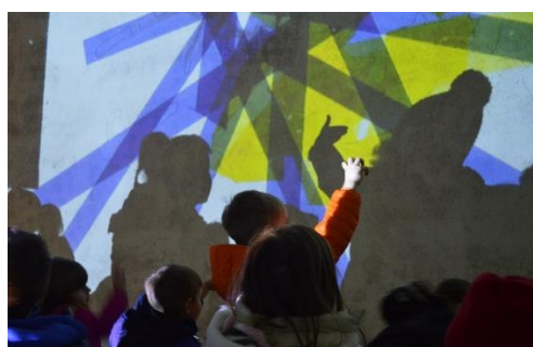
Centro Infanzia 0-6 Terre D'Infanzia Uscita presso EATALY per la mostra Bruno Munari