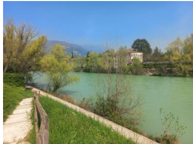
Percorso pedonale lungo il fiume Brenta a Bassano del Grappa