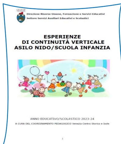
Copertina Continuità Verticale condivisa Servizi 0-6 territorio Comune di Venezia